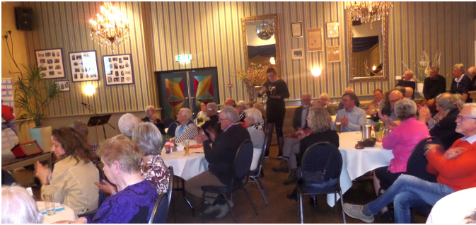
Eén van de Boxmeerse schrijvers stelt zich voor bij Vertellis in Hotel Riche.

In het verlengde van deze presentatie vond op 5 april 2022 in Hotel Riche een presentatie plaats van zeven Boxmeerse schrijvers voor de Boxmeerse Sociëteit. Onder de titel 'Vertellis' werden voor de tweede keer een aantal Boxmeerse schrijvers voorgesteld aan de leden van de sociëteit en was er volop gelegenheid nader met hen kennis te maken.