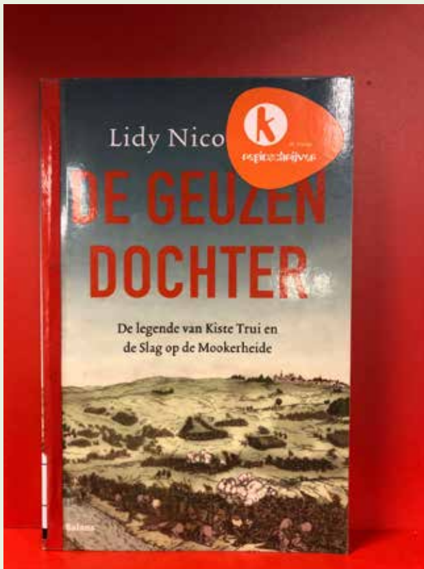
De regioschrijverssticker van BiblioPlus.

dereen die zichzelf schrijver noemt en in deze regio woont of ermee verbonden is' door De Kneep als 'regioschrijver' wordt beschouwd. Sommigen vinden het begrip te ruim en zouden een beperking willen, namelijk dat een schrijver ook gepubliceerd moet hebben. Een ander pleit ervoor liever te spreken van 'schrijvers uit de regio' in plaats van regioschrijvers. 5 procent vindt dan ook dat ze niet terecht op de lijst van De Kneep staat, 18 procent twijfelt, maar 93 procent wil wel op de lijst geregistreerd blijven.