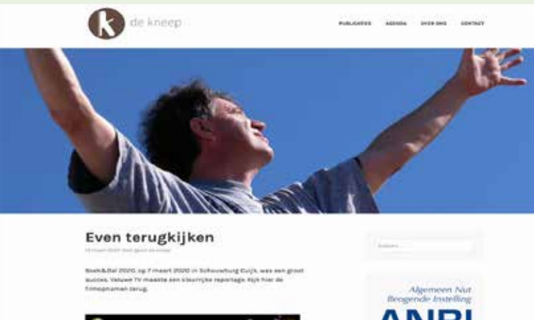
De website van De Kneep.

De Kneep is een vrijwilligersorganisatie, bestaande uit schrijvers uit de regio en geëngageerde personen die zich samen sterk maken voor de