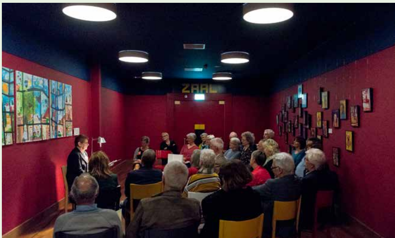
Voorleessessie tijdens Boek&Bal 2019