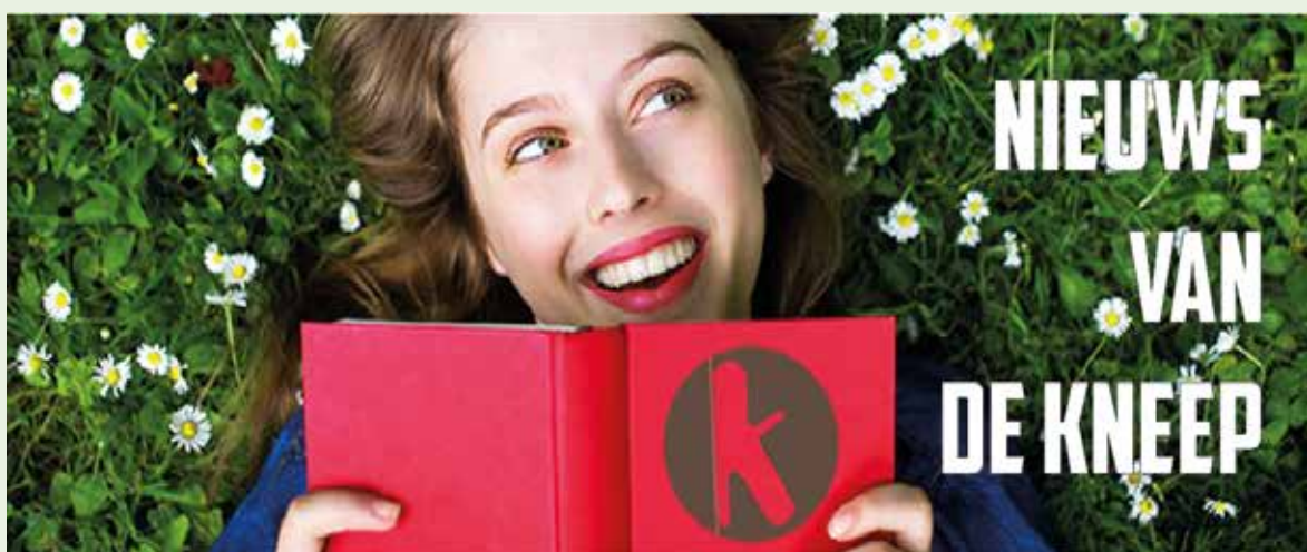
De 'header' van de Nieuwsbrief van De Kneep

De Kneep startte in 2017 met een lijst van zestig 'regioschrijvers', met name uit een lijst die werd bijgehouden door BiblioPlus. In de afgelopen jaren werd de lijst aanzienlijk uitgebreid, mede doordat De Kneep de definitie van regioschrijver verruimde. Zij stelde vast: 'een schrijver (m/v) is, wie zich schrijver noemt. Een regioschrijver is een schrijver die woont of werkt in het Land van Cuijk of Maasduinen dan wel met die regio een sterke binding heeft.'